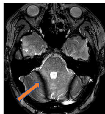
3D FIESTA (TrueFISP) shows phase artifacts at skull base

(Forrás: https://mriquestions.com/fiesta-v-fiesta-c.html ).