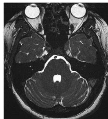
3D FIESTA-C (CISS) with reduced artifacts

95. Ezzel szemben a BSSFP szekvenciák leginkább a mozgó szervek nagy sebességű képalkotását teszik lehetővé, például kardiológiai MR során használt mozi szerű képalkotás (cine imaging) a mozgó szívről vagy a vékonybél leképezése (MR enterográfia). Köszönhetően ultra gyors mérési idejének sokkal ellenállóbb a képminőséget negatívan befolyásoló mozgási műtermékekkel szemben.